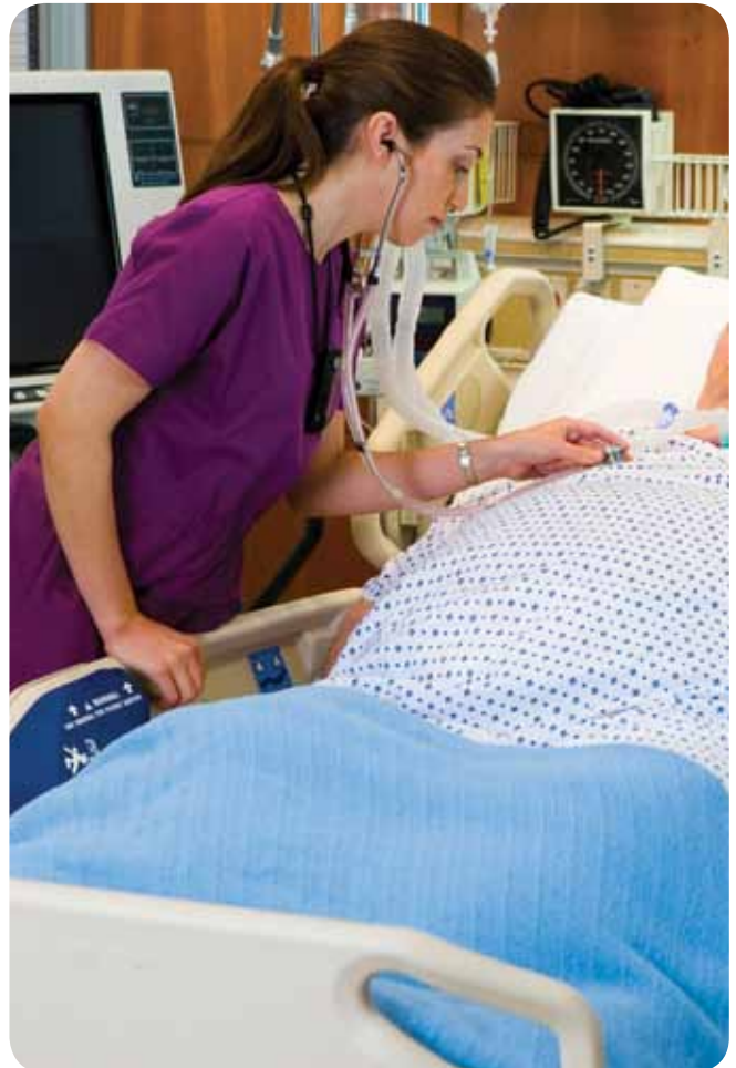
Therapeutische gewichtcapaciteit van 227 kg, mogelijk in een aantrekkelijk bed.