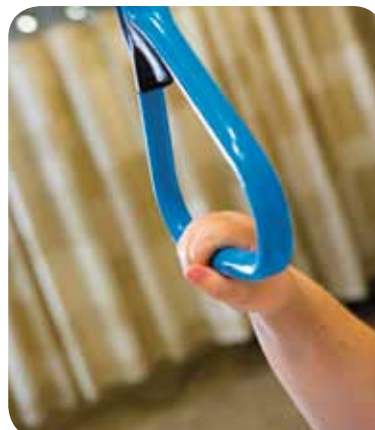
Met de papegaai-trapeze kunnen patiënten zichzelf zonder hulp verplaatsen in bed.