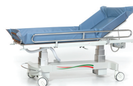
Douchebrancard Colonna XL (300 kg)