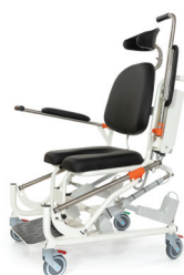
Hoog/Laag Douchestoel Toba XL (250 kg)