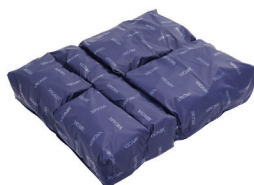
Zitkussen Academy (500 kg)