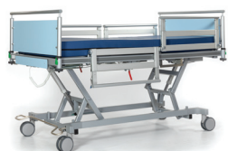
Ziekenhuisbed Dreamer (300 kg)