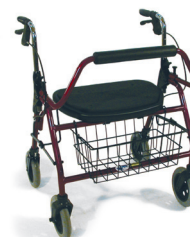
Rollator Freedom (200 kg)