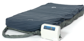
Wisseldrukmatras Royal Air (270 kg)