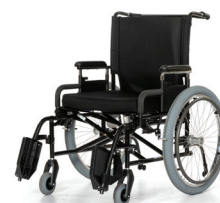
Rolstoel Quickie M6 (295 kg)