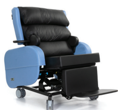
Zorgstoel Sorrento XL (295 kg)