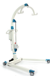
Tillift Carlo XL (230 kg)