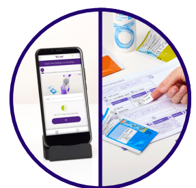
Het Audit & Quality Register of de Tristel Traceability App

is geïmpregneerd met gedemineraliseerd water en heeft een laag antioxidantengehalte, en wordt gebruikt om chemische resten van het oppervlak te verwijderen.