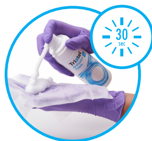
Het Sporicide doekje en Activatorschuim

wordt gebruikt om vuil en organisch materiaal van het medisch hulpmiddel te verwijderen. Het Reinigingsdoekje is geïmpregneerd met een drievoudig enzymatisch detergent en een oppervlakte-actieve stof.