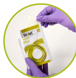
Het Spoeldoekje (Tristel Rinse Wipe)

worden gecombineerd om chloordioxide te genereren, een zeer effectief biocide dat in 30 seconden actief is tegen bacteriën, schimmels, virussen, mycobacteriën en sporen.