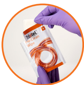
Het Reinigingsdoekje (Tristel Pre-Clean Wipe)

wordt gebruikt om vuil en organisch materiaal van het medisch hulpmiddel te verwijderen. Het Reinigingsdoekje is geïmpregneerd met een drievoudig enzymatisch detergent en een oppervlakte-actieve stof.