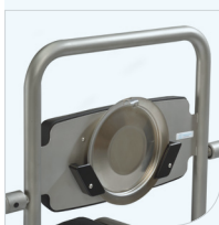
Houder t.b.v. deksel